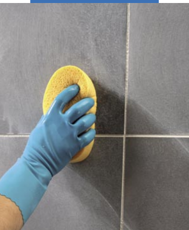
Konečná úprava povrchu houbou z tvrdé celulózy