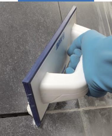
Spárování obkladů Flexcolorem gumovou spárovací stěrkou Mapei