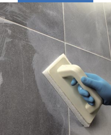
Čištění obkladů houbou Scotch-Brite®